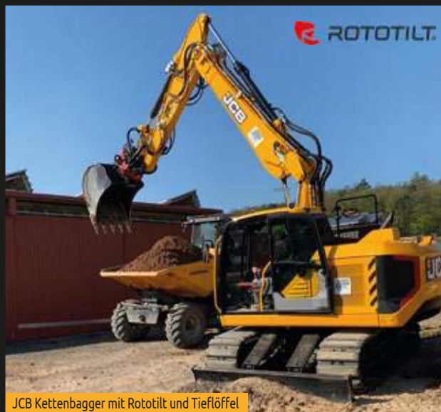
JCB Kettenbagger mit Rototilt und Tieflöffel