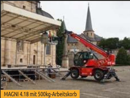
MAGNI 4.18 mit 500kg-Arbeitskorb