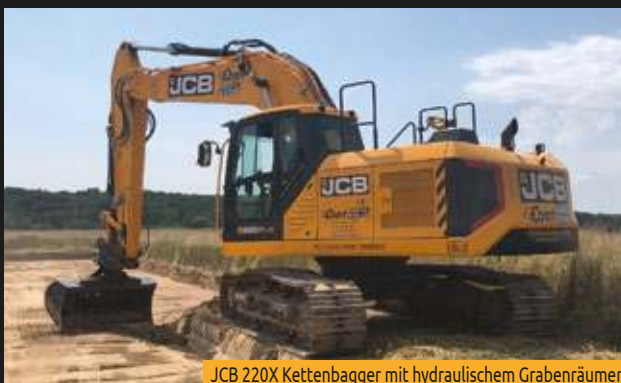
JCB 220X Kettenbagger mit hydraulischem Grabenräumer