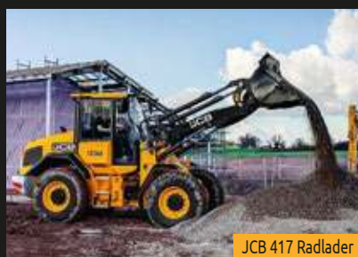
JCB 417 Radlader