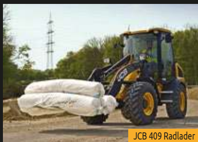
JCB 409 Radlader