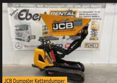
JCB Dumpster Kettendumper