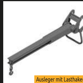
Ausleger mit Lasthaken