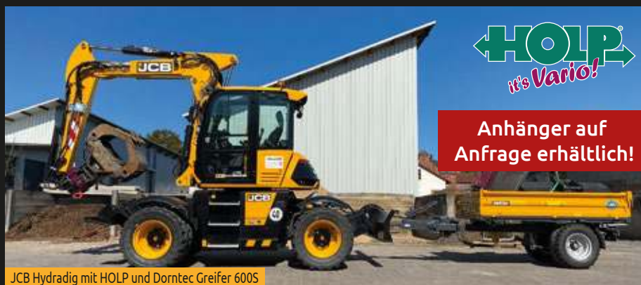
JCB Hydradig mit HOLP und Dornotec Greifer 600S