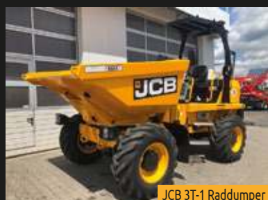
JCB 3T-1 Raddumper