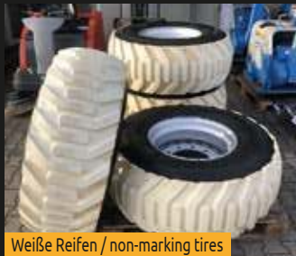
Weißer Reifen / non-marking tires