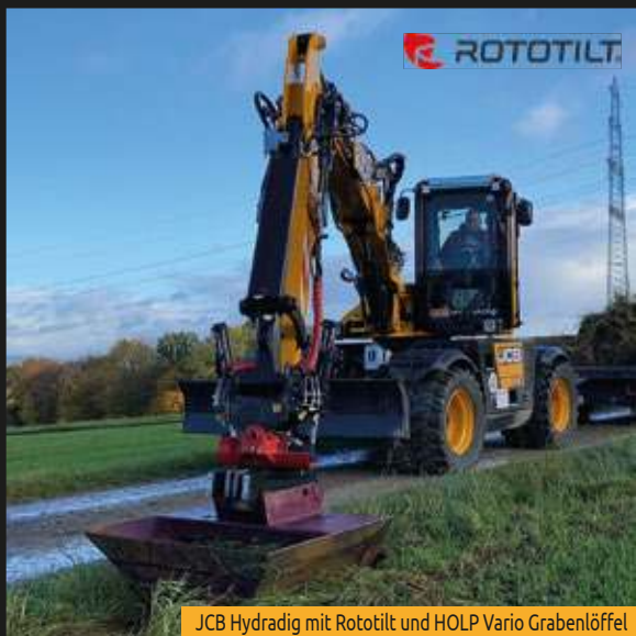
JCB Hydradig mit Rototilt und HOLP Vario Grabenlöffel