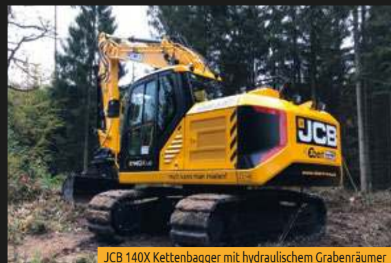
JCB 140X Kettenbagger mit hydraulischem Grabenräumer