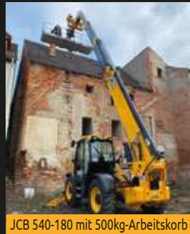
JCB 540-180 mit 500kg-Arbeitskorb