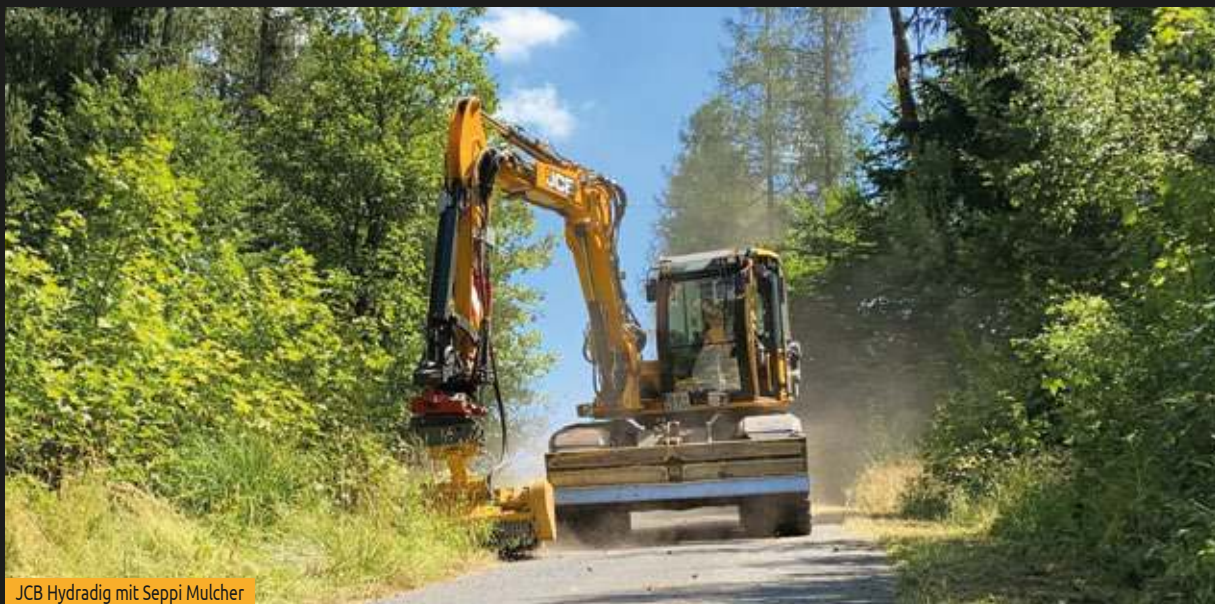
JCB Hydradig mit Seppi Mulcher