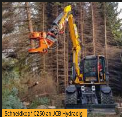
Schneidkopf C250 an JCB Hydradig