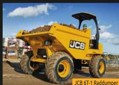
JCB 6T-1 Raddumper