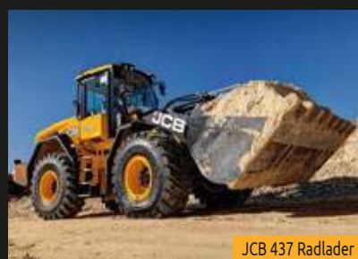
JCB 437 Radlader