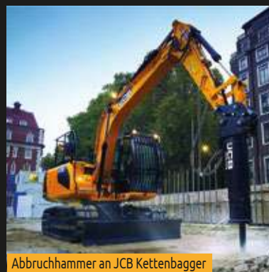
Abbruchhammer an JCB Kettenbagger