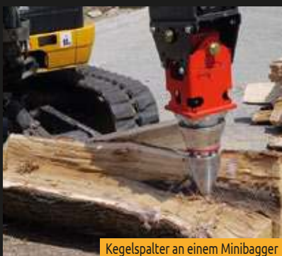
Kegelspalter an einem Minibagger