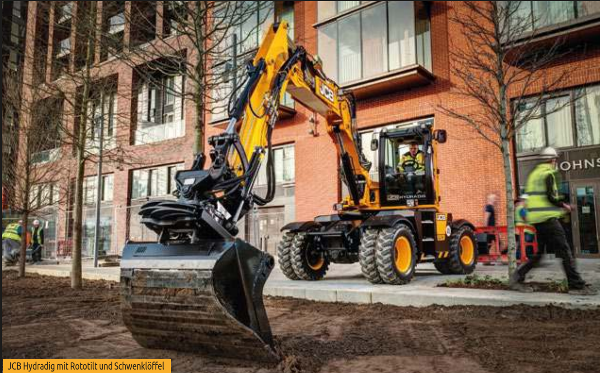
JCB Hydradig mit Rototilt und Schwenklöffel