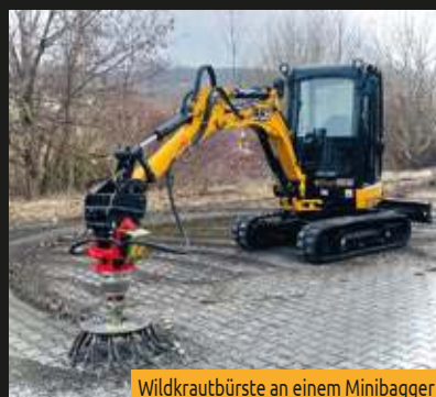
Wildkrautbürste an einem Minibagger