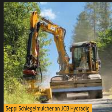
Seppi Schlegelmulcher an JCB Hydradig