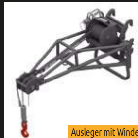
Ausleger mit Winde