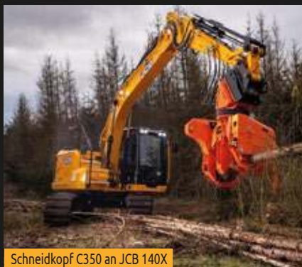
Schneidkopf C350 an JCB 140X