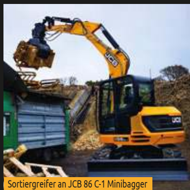
Sortiergreifer an JCB 86 C-1 Minibagger