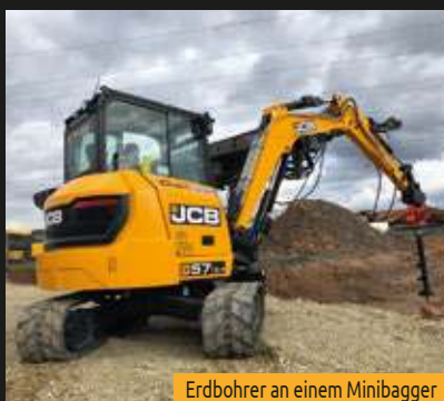
Erdbohrer an einem Minibagger